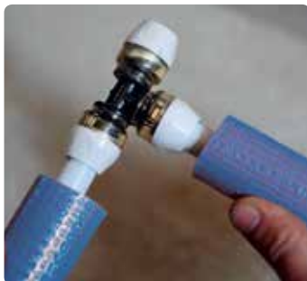
Schnelle und einfache Montage mit vorgedämmten Uni Pipe PLUS Röhren.

Gleiche Farbkodierung für RTM™- und Presstechnologie.