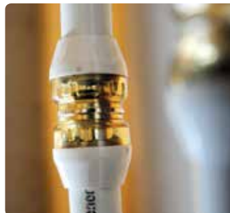
Optisch ansprechende Aufputz-installation.