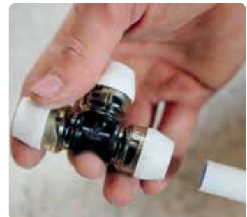
Perfekte Installationslösung gerade an schwer zugänglichen Stellen, z. B. in Installations-schächten.